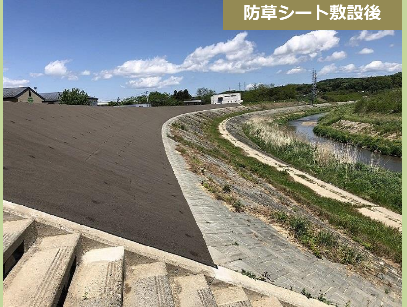
防草シート敷設後