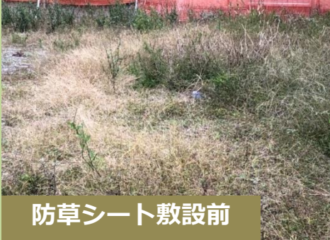
防草シート敷設前